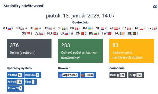
Website traffic statistics with CMS Joomla 4