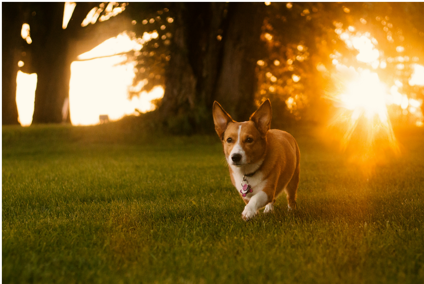
Web stránka pre domáceho milá?ika